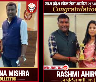
RASHMI AHIRWAR — उप पुलिस अधीक्षक (DSP) —